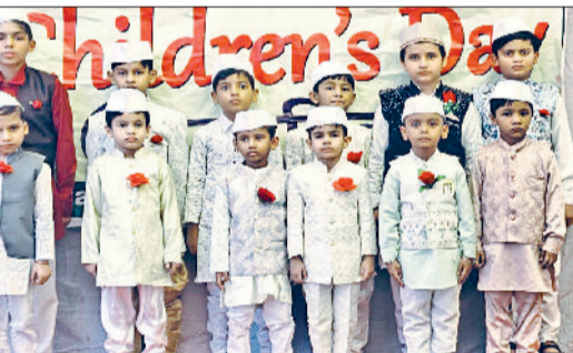
जींद। कार्यक्रम में भाग लेते बच्चे।

उन्होंने देश के विकास के लिए अनेक योजनाएं शुरू की। हरित क्रांति से देश को अनाज उत्पादन में आत्मनिर्भर बनाया। सिंचाई के लिए बड़े-बड़े बांध बनवाए। शिक्षा तथा स्वास्थ्य पर विशेष जोर दिया। देश को अंतरराष्ट्रीय स्तर पर अलग पहचान बनाई। विज्ञान तथा प्रौद्योगिकी को बढ़ावा दिया। देश के