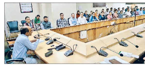
जींद। बैठक को संबोधित करते एसडीएम।