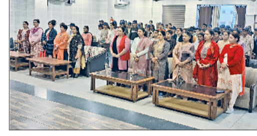
नरवाना। वंदे मातरम गीत गाते प्राध्यापिकाएं।