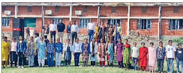
कैथल। राष्ट्रीय एकता का संदेश देती छात्राएं।