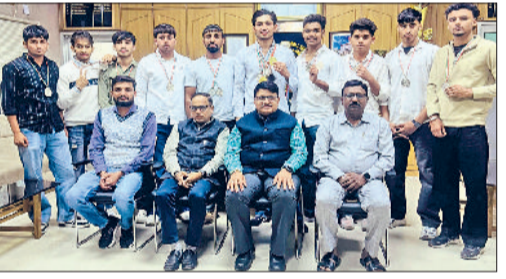
कैथल। खिलाड़ियों को सम्मानित करते पदाधिकारी।