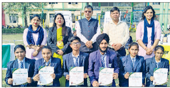
जीद। प्रतिभावान बच्चों को सम्मानित करते हुए।

वुड स्टॉक स्कूल में बाल दिवस बड़े ही हर्षोल्लास और उत्साह के साथ मनाया गया। यह विशेष दिन बच्चों की मासूमियत, ऊर्जा और रचनात्मकता को समर्पित रहा। विद्यालय परिसर पूरे दिन बच्चों की हंसी और खुशियों से गुंजा रहा। कार्यक्रम की शुरुआत प्रार्थना और सरस्वती वंदना से हुई। पूरे विद्यालय में कक्षा वार विशेष गतिविधियों का आयोजन किया गया। कक्षा सातवीं से बारहवीं तक के विद्यार्थियों के लिए हाउस वाइज क्विज प्रतियोगिता का आयोजन किया गया। क्विज का विषय हरियाणा राज्य रहा। जिसमें प्रतिभागियों ने हरियाणा के इतिहास, संस्कृति, खेल, भूगोल और महान व्यक्तित्वों से संबंधित प्रश्नों का उत्तर दिया।