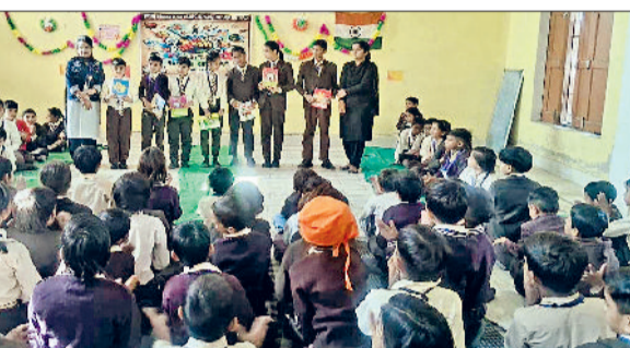
राजौड़। कार्यक्रम में भाग लेते हुए विद्यार्थी व स्टाफ सदस्य।