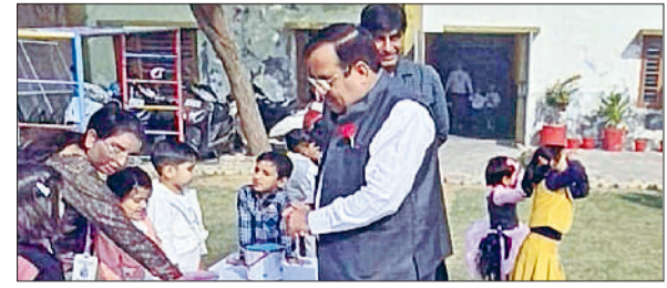
जींद। बाल मेले में भाग लेते हुए बच्चे।