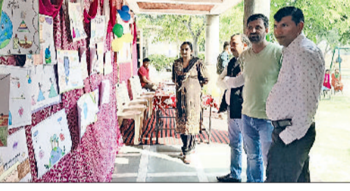
गांव करोड़ा में प्रतियोगिता के दौरान सरकारी स्कूल के अध्यापक।