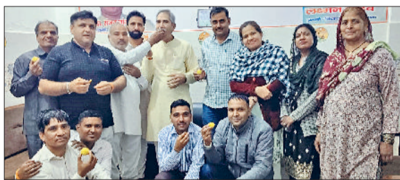
बिहार में एनडीए की जीत पर मिठाई बाँटते भाजपा कार्यकर्ता।