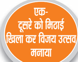
हरिभूमि न्यूज ॥ जींद