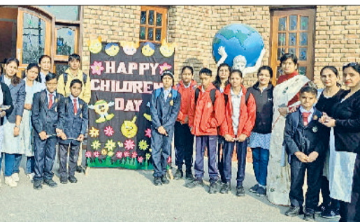
जींद। कार्यक्रम में भाग लेते हुए बच्चे।