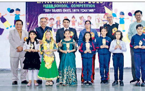
जींद। प्रतियोगिता के विजेता विद्यार्थी प्रबंधक समिति के साथ।