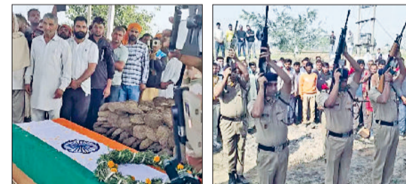
नरवाना। मृतक शहीद का अंतिम संस्कार करते व अंतिम सलामी देते हुए।

सभी अधिकारी अपने-अपने क्षेत्र की दैनिक रिपोर्ट विभाग को अनिवार्य रूप से भेजें। एसडीएम ने कहा कि कंट्रॉल के अंतिम दिनों में किसानों के सामने अगली फसल की बुआई के लिए सव्य सीमित होता है एसडीएम ने कहा कि प्रशासनिक टीमें आगामी दिनों में शनिवार एवं रविवार सहित निरंतर फील्ड में सक्रिय रहेंगी। अंत में उन्होंने किसानों से अपील की कि वे पराली जलाने के बजाय उपलब्ध वैकल्पिक प्रबंधन विधियों का उपयोग करें ताकि पर्यावरण संरक्षण के साथ-साथ किसी भी प्रकार की कार्वार्ड से बचा जा सकें। उन्होंने अवसर किया कि जिला प्रशासन किसानों की समस्याओं को समझते हुए उन्हें हर संभव सहायता प्रदान करेगा।