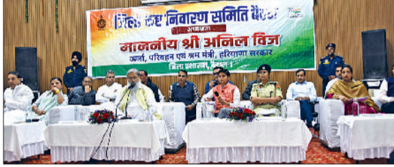
कैथल। परिवहन मंत्री अनिल विज कष्ट निवारण समिति की बैठक को संबोधित करते।