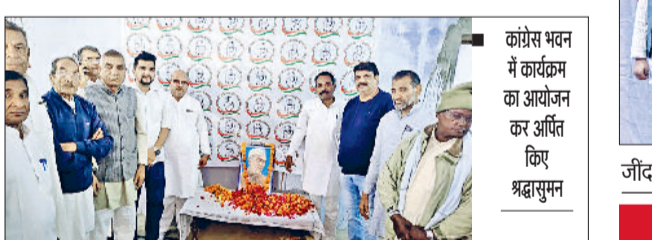
कांग्रेस भवन में कार्यक्रम का आयोजन कर अर्पित किए श्रद्धासुमन